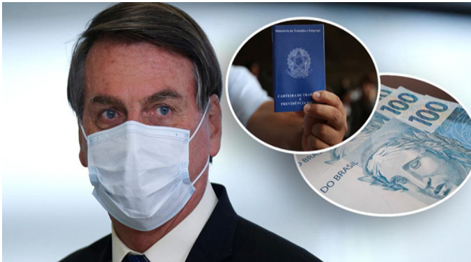
Jair Bolsonaro, carteira de trabalho e dinheiro

Jair Bolsonaro prorroga por dois meses a possibilidade de suspensão de contratos de trabalho e corte de jornada e salário. Trabalhadores estão sem qualquer proteção na crise: 10 milhões já foram prejudicados