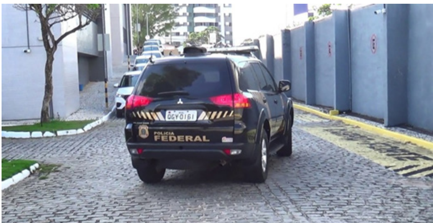
Polícia Federal faz operação no Seridó potiguar

Cerca de 30 agentes cumpriram cinco mandados de prisão preventiva e quatro mandados de busca e apreensão nos municípios de Caicó e Ipueiras.